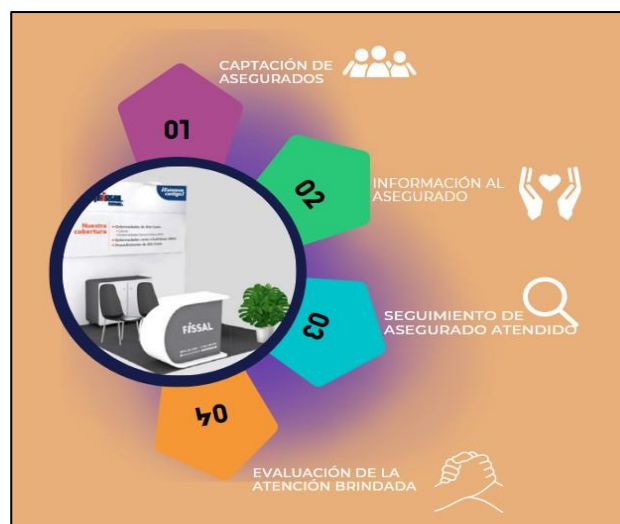
Figura N°02: Estrategia aplicada en los módulos FISSAL